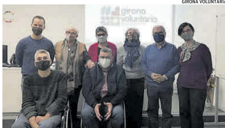
Alguns dels representants de les entitats constituents de Girona Voluntària.

■ La coordinadora té per objectiu promoure un nou tipus de voluntariat, que s'obri a nous perfils de col·laboradors, i amplii les activitats més enllà de l'acció social. ▶7