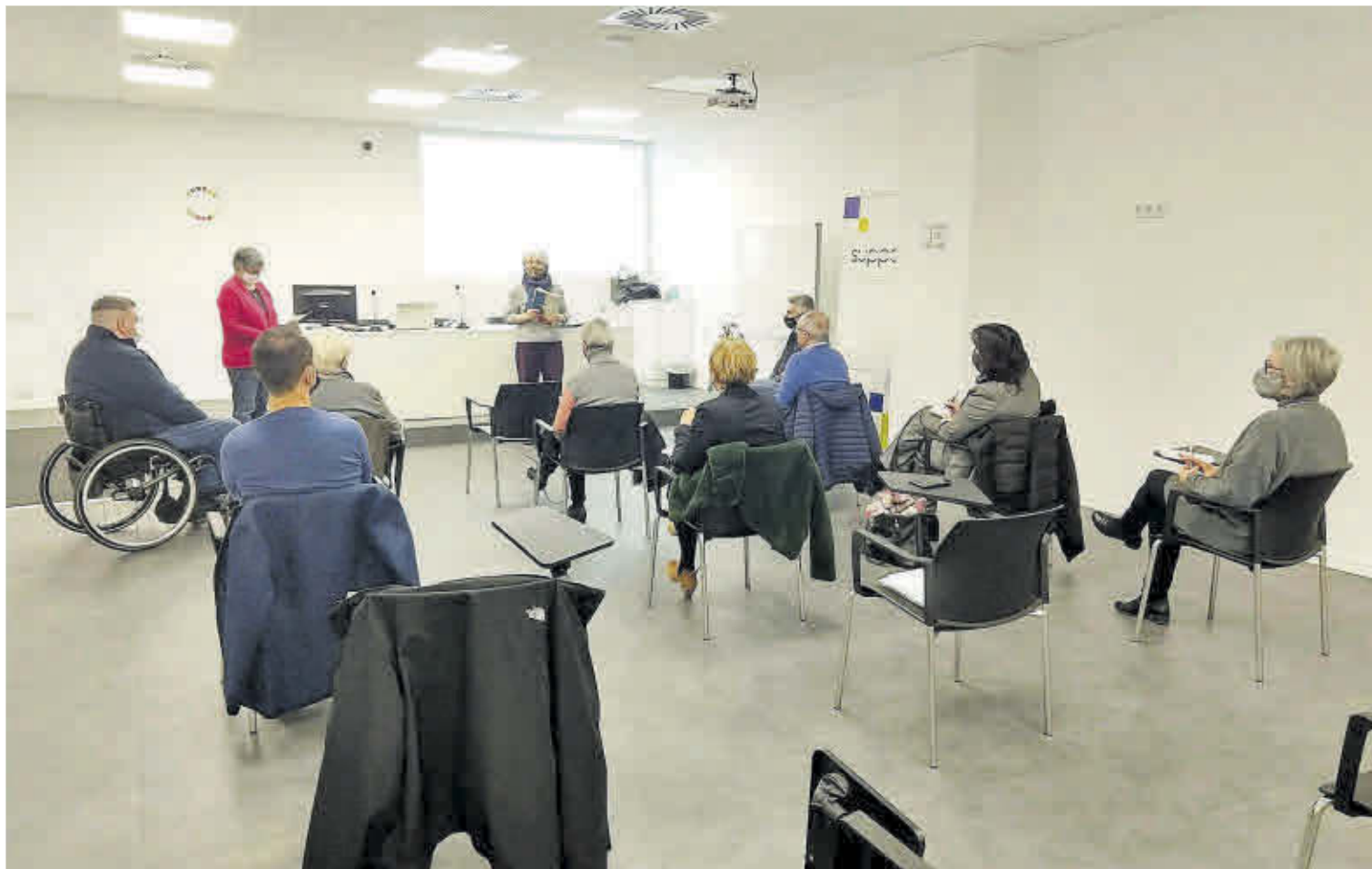
Alguns dels representants de les entitats durant la trobada constituent de Girona Voluntària.