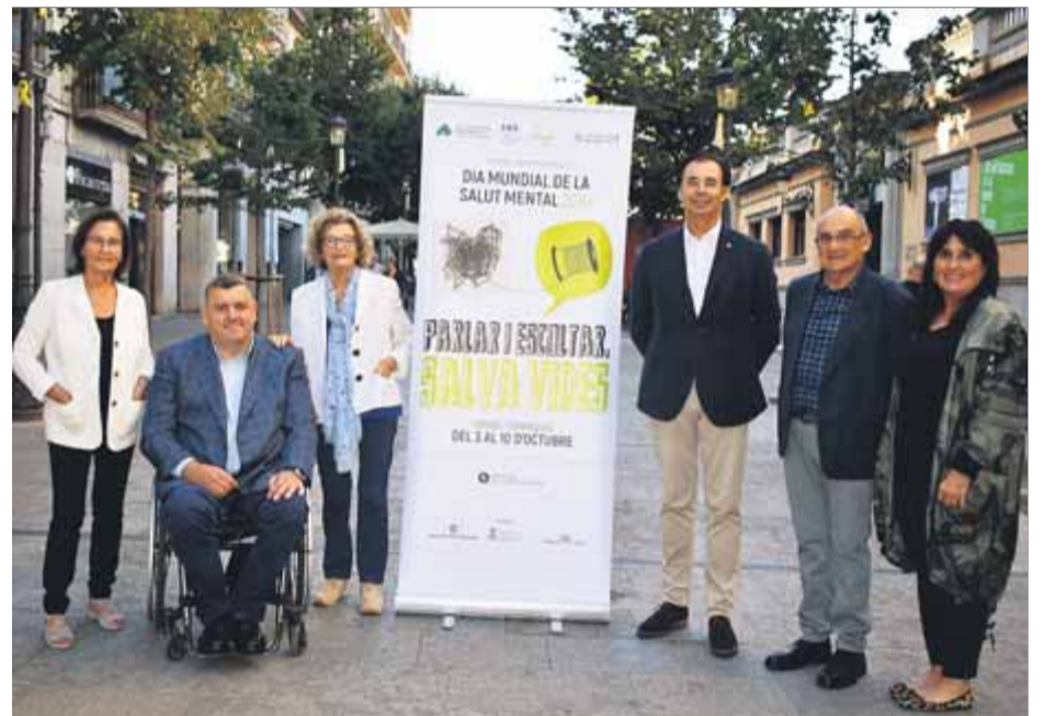
Representants de les entitats organitzadores, amb el cartell, ahir a la Rambla

Els representants de les entitats i institucions gironines que han organitzat de forma conjunta aquestes trentena d'activitats –l'Associació Família i Salut Mental de Girona i co-